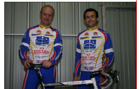
Le nouveau maillot de la section