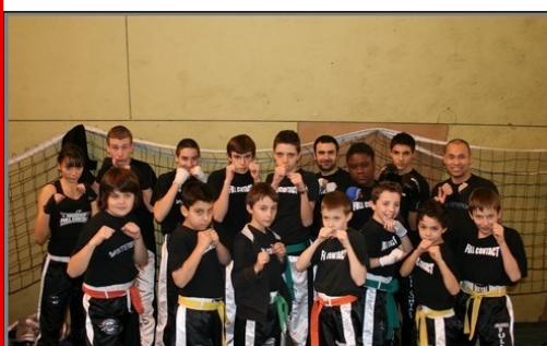
Nos petits champions

Cette école de boxe qualitative affiche neuf titres de champion d'Aquitaine 2010 dans toutes les catégories, six titres de vice-champions et trois places sur la troisième marche du podium. Un véritable carton plein qui place le club sur la plus haute marche d'Aquitaine pour cet événement et alignera 18 compétiteurs qualifiés pour les « France ».