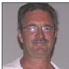
Et l'avenir ?

la même chose qu'arriver le jour même. Par exemple pour comparer les budgets, celui de Poitiers est de 200 000€ pour 11 000€ chez nous. On fait avec.