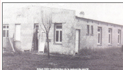
Début 1982 Construction de la maison du sportif

C'est pourquoi, en ce renouveau de communication, nous pensons qu'il est bon de leur faire connaître depuis les débuts : LE FOYER DE L' A.S.A.