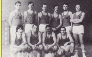
Notre 1ère équipe de basket en 1971