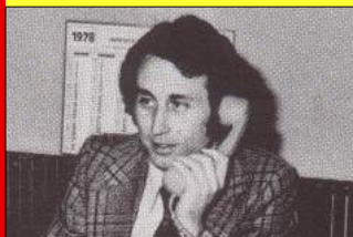
Non, tu n'as pas changé ....

Inscriptions aquagym 13 et 22 sept 10h 15 et 20 sept 19h