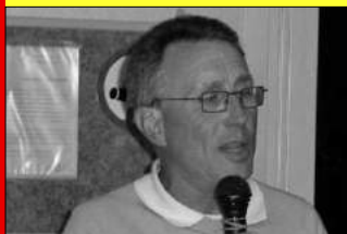
Un rédacteur de l'ASA Info ....