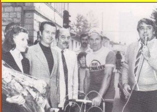
L'ASA cyclisme, Mai 1981 Grand prix des commerçants

Du 10 mars au 24 mars tournoi jeunes de tennis