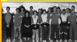
Sport endurance Saison 1994.1995

Inscriptions aquagym Mardi 11/09 à 11h Jeudi 13/09 à 19h Mardi 18/09 à 19h Jeudi 20/09 à 11h