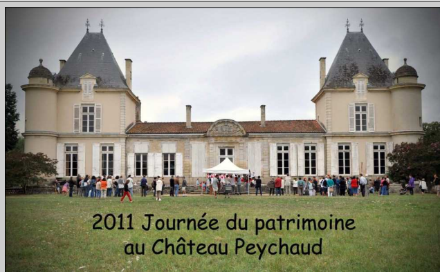
2011 Journée du patrimoine au Château Peychaud

Cet événement organisé par la municipalité aura lieu le Samedi 15 Septembre prochain. Le thème en sera le Sport, des hommes et des lieux.