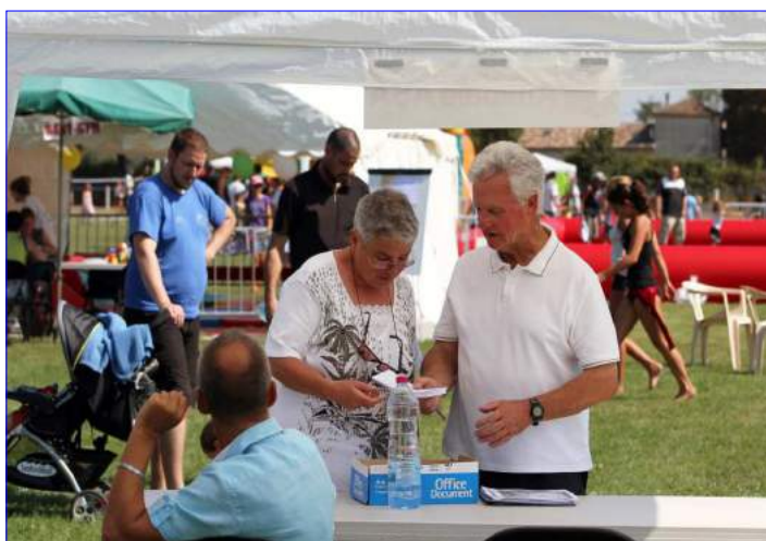
Stand de l'Amicale, Sportez-Vous Bien 2012