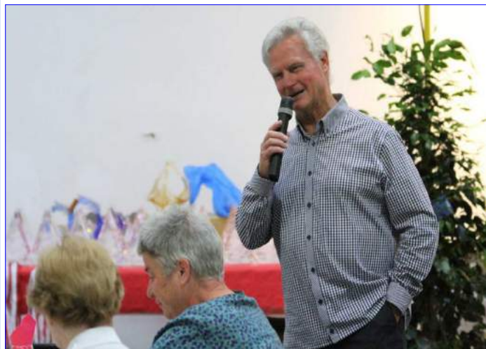
Les Trophées de l'ASA 2012