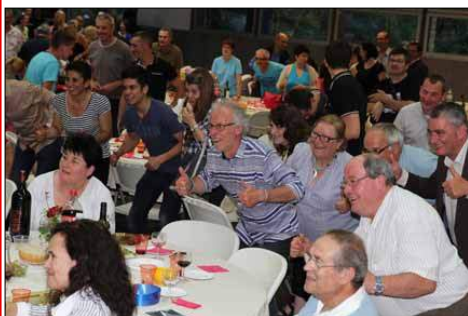
Et tout le monde leva le pouce en l'honneur de l'ASA.

Digne d'une cérémonie des Césars, c'est la grande famille de l'A.S.A. qui était, dernièrement, réunie lors de la belle soirée de remise des Trophées de l'A.S.A. Avec un service assuré par les jeunes de la commission. Cette soirée réunissant 320 personnes, bénévoles et dirigeants, partenaires et élus a permis la remise des récompenses et médailles aux récipiendaires.