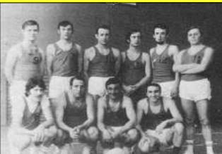
1ère équipe masculine Basket-ball saison 71.72