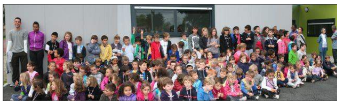
Remise de médailles et goûter bien mérité le 19 Juin dernier devant le foyer pour la fin de l'année des écoles d'éveil et multisports.