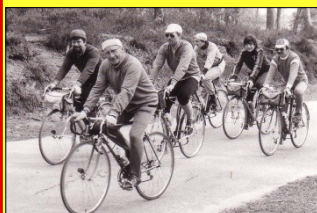
La section Cyclotourisme en 1983