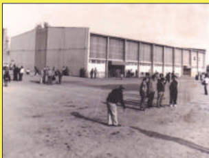
Concours de pétanque en 1982