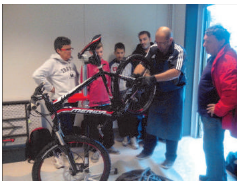
Le Président Pédagogue Thierry LEBON

Président Thierry LEBON pour la première séance le samedi 7 septembre. Le sujet à l'honneur, " la roue de mon vélo" a permis de découvrir les secrets du démontage,