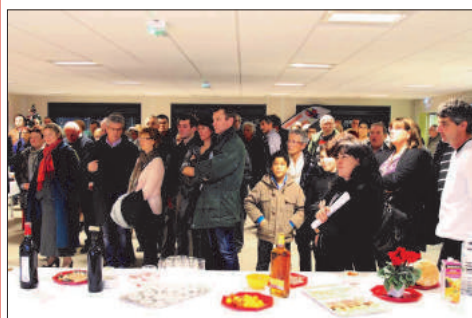
Soirée des vœux de l'ASA, vendredi 10 janvier 2014

Cet équipement réalisé par la commune répond parfaitement aux attentes de notre association : regroupement des services administratifs, mise à disposition d'une grande salle pour les réunions conviviales des sections, d'une petite salle pour les après matchs, d'une cuisine équipée, de deux locaux de rangement du matériel et d'un local pour l'atelier pédagogique d'entretien des cycles.