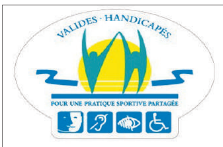
table vient d'être labellisée "accueil handi". Elle organise également, le 17 Mai 2014 dans la salle omnisports Charles Fabre, une compétition ouverte aux déficients mentaux. La section tir à l'arc est aussi en cours de labellisation.... d'autres suivront.

Le handicap ! Quel handicap ? La liste pourrait être longue et même si la vocation du milieu associatif en général est de tous les prendre en compte, en fonction de son savoir faire et de son objet, le parti pris de ces quelques lignes est de situer notre Association dans son action envers le handicap.