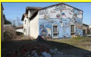
La base nautique hier