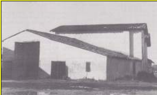
La propriété RIMBAUD en 1980.