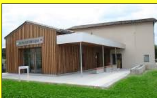
La base nautique aujourd'hui