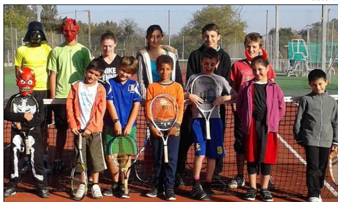
Halloween s'invite au stage de tennis !!