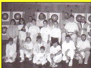
ASA tir à l'arc Saison 1999.2000