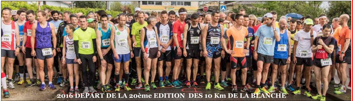
2016 DÉPART DE LA 20ème EDITION DES 10 Km DE LA BLANCHE