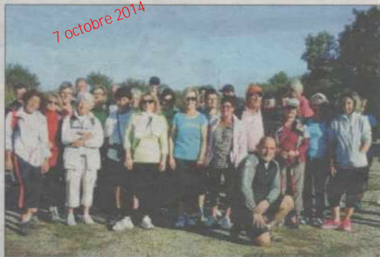
L'un des groupes de la Journée mondiale de la marche.