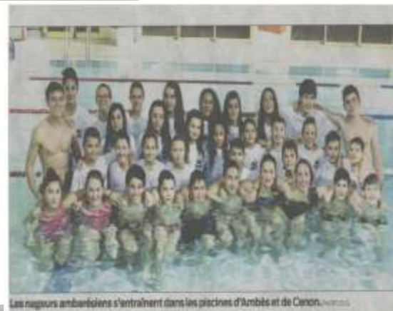
Les nageurs ambarésiens s'entraînent dans les piscines d'Ambès et de Cenon.

encore accueillir quelques nageurs, ils se retrouvent tous les mardis à la piscine d'Ambès de 20 h 30 à 21 h 30.