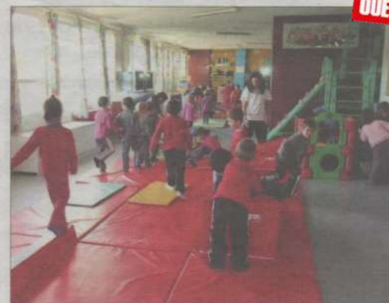
Les enfants en pleine activité.

Deux écoles, destinées aux enfants de 4 à 11 ans, sont ouvertes au sein de l'ASA. 40 places sont offertes aux enfants de 4 et 5 ans à l'école de l'éveil sportif. L'objectif de cette école est de développer chez l'enfant son capital vitalité, la stimulation, la motricité et de permettre ainsi une socialisation des plus jeunes par une grande variété de jeux d'éveil qui vont de l'acroport à l'activité cycle.