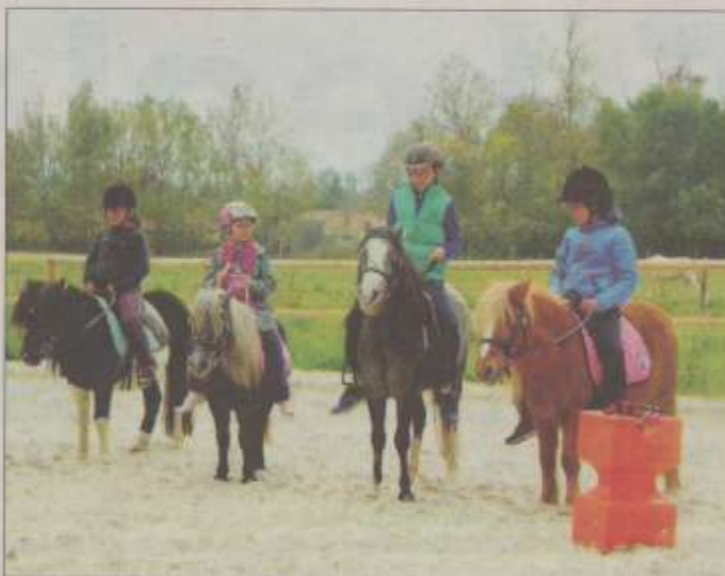
Les jeunes cavaliers, fiers sur leurs montures.