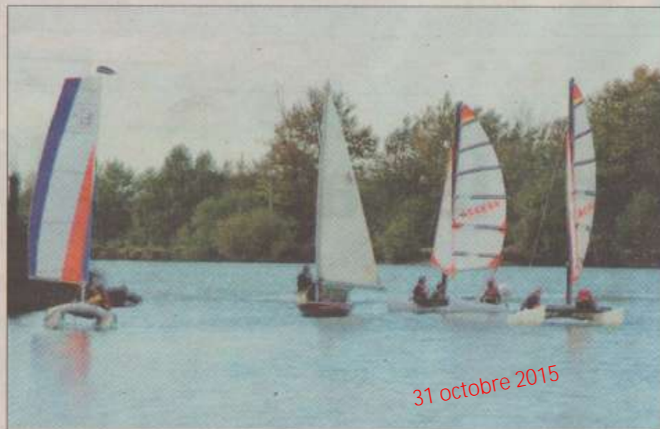
Toutes voiles dehors. PHOTO D. G.