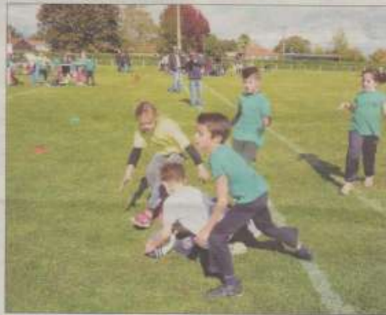
Des actions de jeu dans la pure tradition.

Jeudi, réunis autour du ballon ovale, pour une journée de rugby sur le thème de la Coupe du monde, 266 enfants des petites sections de maternelle au CM2 de l'école Saint-Pierre/Saint-Michel ont participé à un tournoi où chaque classe représentait l'un des pays participant actuellement à la Coupe du monde. Initiée par le club de rugby de l'Entente Ambarès-Saint-Loubès, l'association Drop de béton et Joël Martin le coordinateur de cette manifestation, avec le soutien de l'ASA, de la ville d'Ambarès, cette journée était placée sur la double thématique sport et santé.