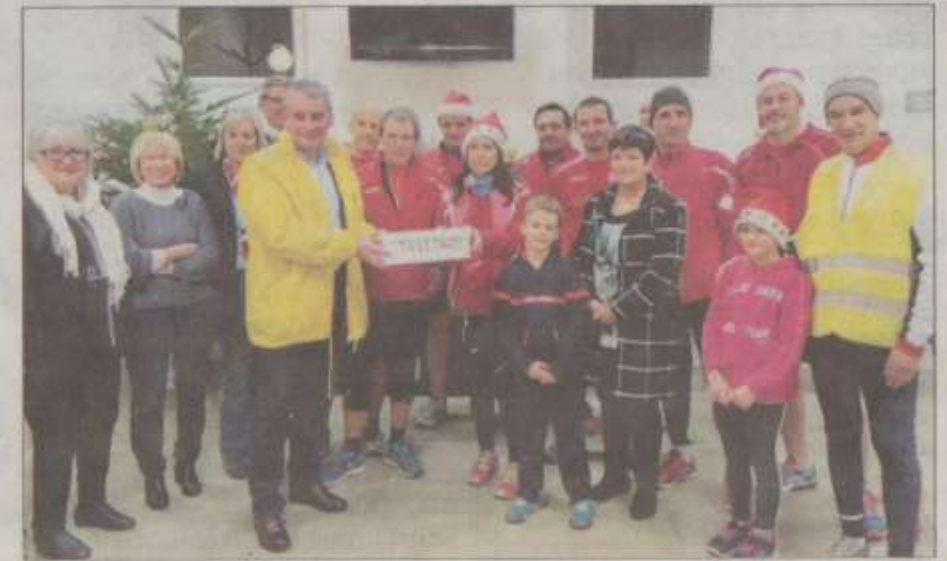
Les coureurs de l'ASA se sont mobilisés en faveur du Téléthon.